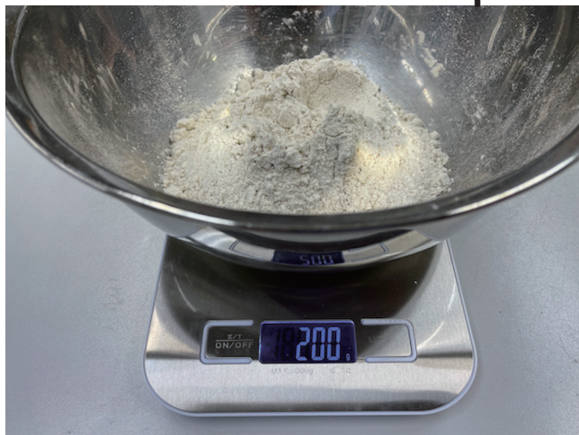
1. Mesure de la farine de sarrasin