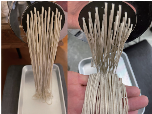
5. Nouilles extrudées