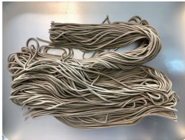
6. Nouilles 100% Sarrasin (Nouilles Fraîches)