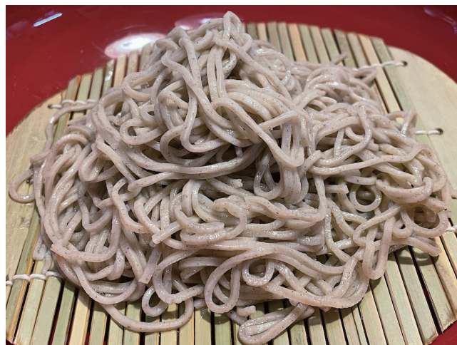
8. Zaru Soba - Nouilles 100% Sarrasin