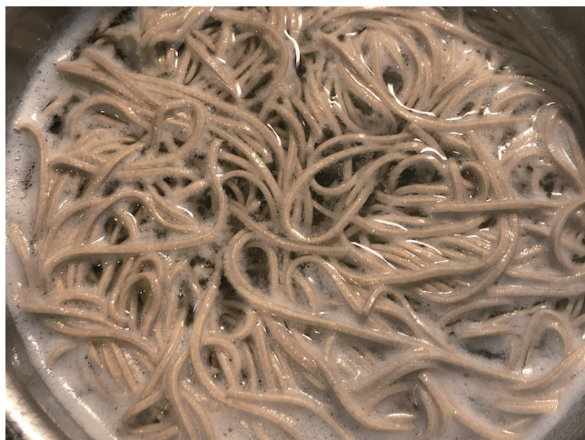
7. Faire bouillir/lavage/serrage à l'eau froide