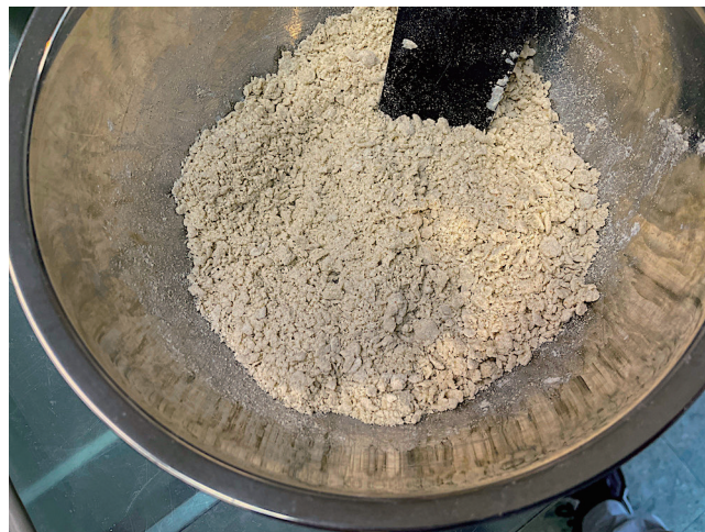
4. Masukkan ke dalam Hopper (Tanpa Pengerasan)