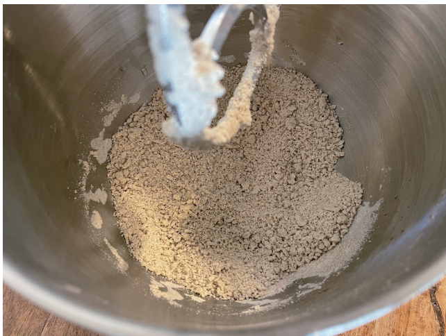
3. Pelembab (Blender/Spatula/Pukul)