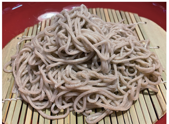
8. ซาธุโซบะ - บะหมี่โซบะ 100%