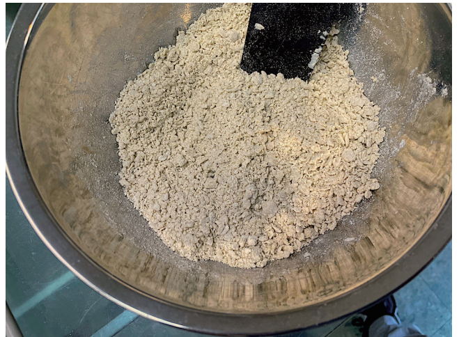
4. ใส่ลงในถัง (ไม่ชอบแข็ง)