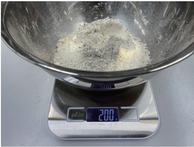
1. การวัดแป้งบัควีท